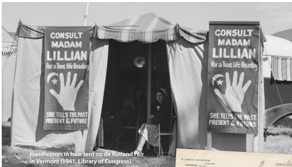
Handlezeres in haar tent op de Rutland Fair in Vermont (1941).