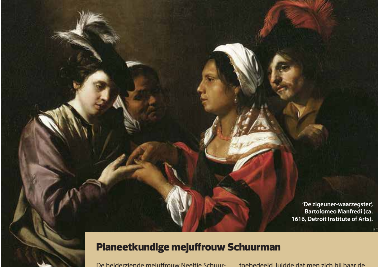
'De zigeuner-waarzegster', Bartolomeo Manfredi (ca. 1616, Detroit Institute of Arts).