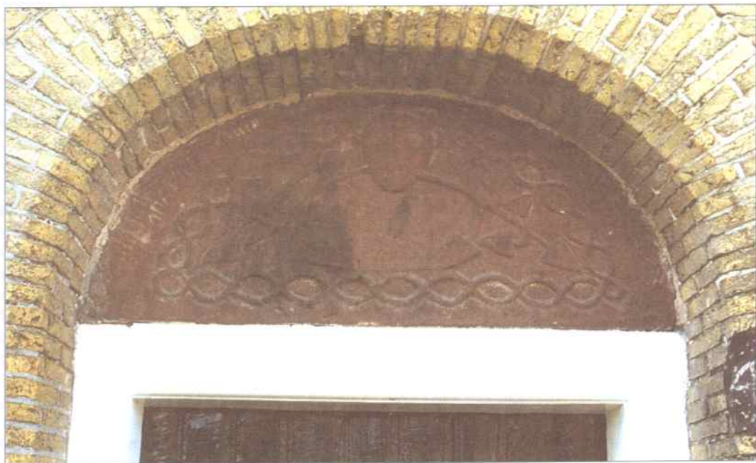
Vegetatie-spruitende kop in timpaan van Laurentiuskerk, Kimswert, Friesland, circa 1150.

koppen, onder meer twee misericordes van de Grote Kerk in Haarlem en de 'wang', een naam voor de zijkant van een koorbank in de Sint Jan in Den Bosch. Misericordes zijn 'billenplankjes' of (Vlaams) 'zitterkes', de opklapbare plankjes van de koorbanken waar de oude monniken op konden zitten als het lange staan tijdens de mis hen te zwaar werd. Aan de onderkant van de bankjes zijn vaak prachtige tafereeltjes houtsnijwerk aangebracht. Sommige voorstellingen zijn te herkennen als spreekwoorden of gezegden, soms beelden ze ambachten en beroepen uit, of bevatten ze stichtende wijsheden. 'De moraliserende voorvallen uit de dierfabels die, uit het Oosten gekomen en in het Westen eindeloos herhaald en gevarieerd, samengroeiden tot het populaire dierenepos Van den vos Reynaerde , komen herhaaldelijk