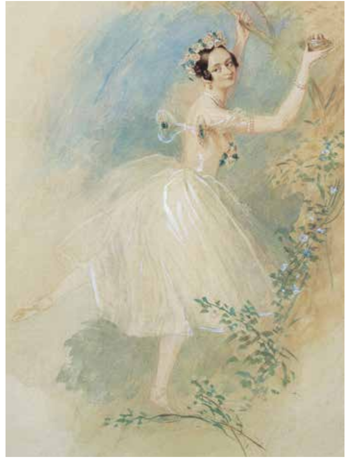
"Marie Taglioni in La Sylphide", Alfred E. Chalon

Een ander verstrengelend iconografisch onderdeel dat zich in de zestiende eeuw aandiende zijn de als klassieke goden en godinnen afgebeelde elementen aarde, water, lucht en vuur. De lucht was in vroeger tijden gewijd aan de godin Juno. Zij had als attribuut de pauw gekregen, en kon door vogels zijn omringd. Voor de uitbeelding van vuur koos men vaak een vrouwsfiguur met een feniks als hoofdtooi, omringd door vlammen. Water raakte verbonden aan de god Neptunes en zijn dochters de Nereïden, de zeenimfen. Dat in de zestiende