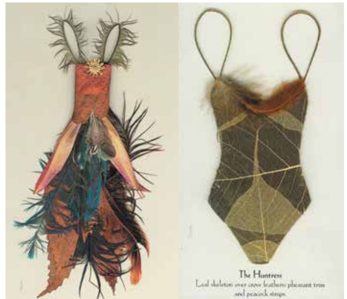
Uit de garderobe van "Fairie-ality", House of Ellwand