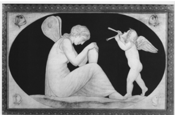
“Eros en Psyché”, Johann H. Meyer

Tijdens de Renaissance beschouwde men het sprookje van de twee geliefden als een wijsgerige allegorie waarin de ziel, Psyche, contact zocht met het verlangen, Amor (ook Eros en Cupido genaamd). De vereniging van de twee resulteerde in vreugde, hun kroost. Door de eeuwen heen zijn er veel afbeeldingen van Psyche en Cupido/Amor/Eros gemaakt. Van de ziel geloofden de oude Grieken dat deze bij de mens via de mond het lichaam verliet op het moment zodra hij of zij de laatste adem uitblies. Symbolisch beeldde men dit op sarcofagen uit als een uit de pop gekropen vlinder. Psyche, het Griekse woord voor ziel en gepersonifieerd in het sprookje van Apuleius, werd een motief dat op vroeg-christelijke grafmonumenten werd overgenomen. Psyche werd stevast afgebeeld met vlindervleugels of er vloog een vlinder in haar buurt.